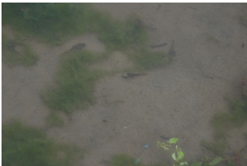
通常のおたまジャクシ