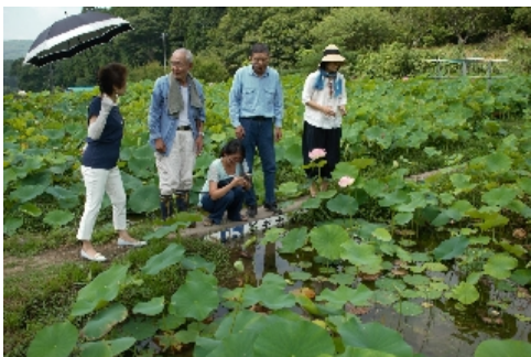
白いおたまジャクシ談議

皆様集まって何か盛り上がっています....なんと、白いおたまジャクシを見つけた模様です。写真左上は通常のおたまジャクシですが、写真右上の中央に白いおたまジャクシが見えます（見にくいですが！）