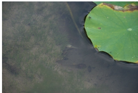
白いおたまジャクシ 写真中央

皆様集まって何か盛り上がっています....なんと、白いおたまジャクシを見つけた模様です。写真左上は通常のおたまジャクシですが、写真右上の中央に白いおたまジャクシが見えます（見にくいですが！）